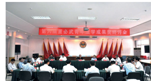
6月12日，第六届董必武青年法学成果奖终评会在京顺利举行

陈冀平指出，“董必武青年法学成果奖”评选活动于2013年正式启动，经过五年的努力，取得了良好的社会效果，评选的参与度和影响力正在日益增强，评选的质量和水平也在稳步提升。“董必武青