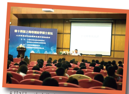
5月3日，由上海市法学会刑法学研究会等主办的第十四届上海市刑法学博士论坛在华东政法大学长宁校区举行，论坛围绕“人工智能时代的刑事风险与刑法应对”主题展开研讨。