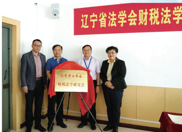
5月28日，辽宁省法学会财税法学研究会成立大会暨第一届学术年会在辽宁大学召开。中国财税法学研究会会长刘剑文与辽宁省法学会副会长院国强为研究会揭牌。