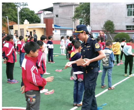
5月9日，福建省南平市松溪县法学会组织县法学会会员、交通部门人员到学校开展“爱路护路，普法进校园”活动。