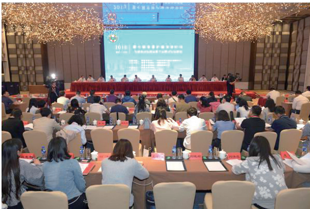
5月10日，以“全面依法治国背景下直辖市法治建设”为主题的第七届京津沪渝法治论坛在天津举行

王乐泉强调，改革开放以来，特别是党的十八大以来，京津沪渝四个直辖市在依法治市、推进法治城市建设方面创造了许多好经验，形成了许多好思想。在新时代全面依法治国新征程上，四个直辖市有着特殊的使命和担当。希望四个直辖市比其他省区更加重视依法治理，把自己建设成为全面依法治国、建设法治中国的示范区、领头羊、排头兵，为全面依法治国创造更多可复制可推广的经验，领跑法治中国建设。四个直辖市都是对外开放的窗口，经济对外依存度都比较高，上海、天津、重庆还建立了自由贸易试验区。直辖市要认真研究当前国际经贸领域发生的各种问题以及对我们的挑战，研究推进“一带一路”过程中遇到及可能遇到的法律问题。以更大的勇气、更快的步伐、更科学的举措全面推进依法治市、加快建设法治