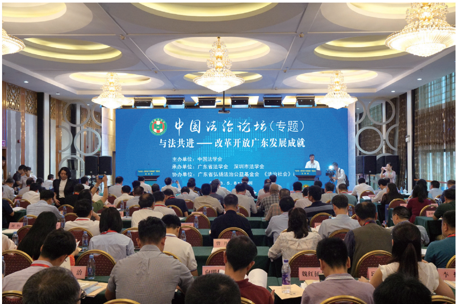
5月8日，中国法治论坛（2018）“与法共进——改革开放广东发展成就”专题论坛在广东省深圳市举行

论坛上，来自广州、深圳、珠海、东莞、汕头、河源市法学会和广东省法学会研究会、法治研究基地的代表，围绕广东各地改革开放发展成就、法治建设促进地方经济社会发展、广东依法行政历程、法治社会评估等内容作论文报告。中国法学会有关部门负责同志，各省级法学会，广东省法学会各学科研究会、各法治研究基地和深圳市各区法学会有关同志，专家学者参加了活动。