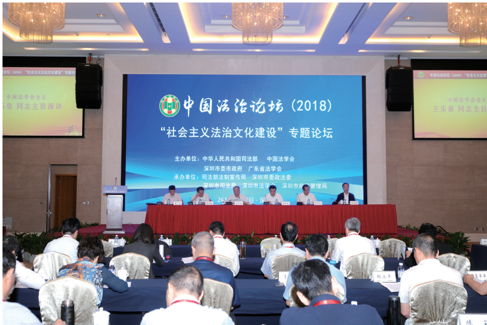
中国法治论坛（2018）社会主义法治文化建设专题论坛在广东深圳举行

中国法学会有关部门负责同志，广东省委政法委、深圳市政府负责同志，各省级法学会、各省区市司法行政系统有关同志，法学法律界专家学者参加了活动。