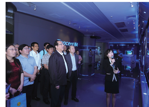
中国法学会组织开展2018年第2期“法学家下基层”专题法治调研

会上，专家学者们纷纷就自己关心的问题向腾讯公司的负责人提问或者发表个人见解。会后，腾讯公司安排调研组一行前往深圳科兴科学园腾讯前沿科技实验室，进行科技+文化体验。