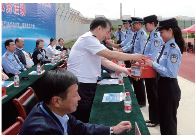
5月31日，青海省2018年度“青年普法志愿者法治文化基层行活动”启动仪式在该省多巴强制戒毒隔离所举行。图为参会领导向强戒所干警捐赠法治文化书籍。