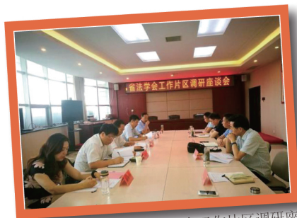
6月21日，河南省法学会工作片区调研座谈会在驻马店市召开。