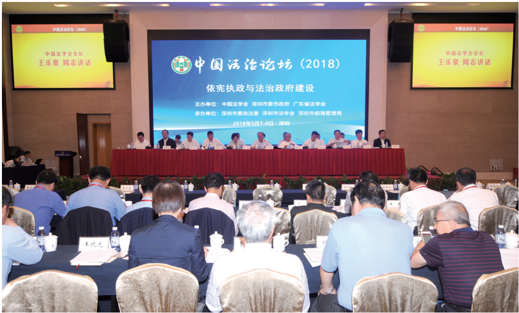
5月7日，中国法治论坛(2018)在广东省深圳市举行