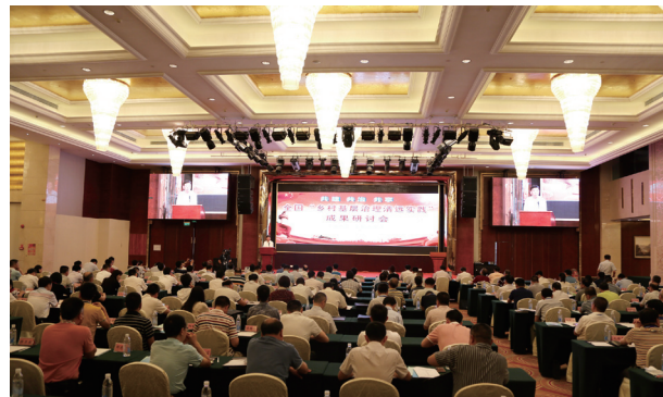
鲍绍坤出席全国乡村治理清远实践研讨会

鲍绍坤在讲话中指出，乡村治理是我国社会治理体系最基础、最重要的环节，加强和创新社会治理，推进社会治理体系和治理能力现代化，重心和难点都在基层。党的十九大报告中明确提出实施乡村振兴战略，这是党中央着眼于全面建成小康社会、基本实现现代化、全面建设社会主义现代化国家作出的重大战略决策，也是解决农村突出问题，使广大人民群众共享改革发展成果的迫切要求。乡村振兴的有效治理就是要建立健全党委领导、政府负责、社会协同、公众参与、法治保障的现代乡村社会治理体制，健全自治、法治、德治相结合的乡村治理体系，实现治理理念、机制、方式等的创新，确保乡村社会充满活力、和谐有序，真正成为大家安居乐业的美丽家园。