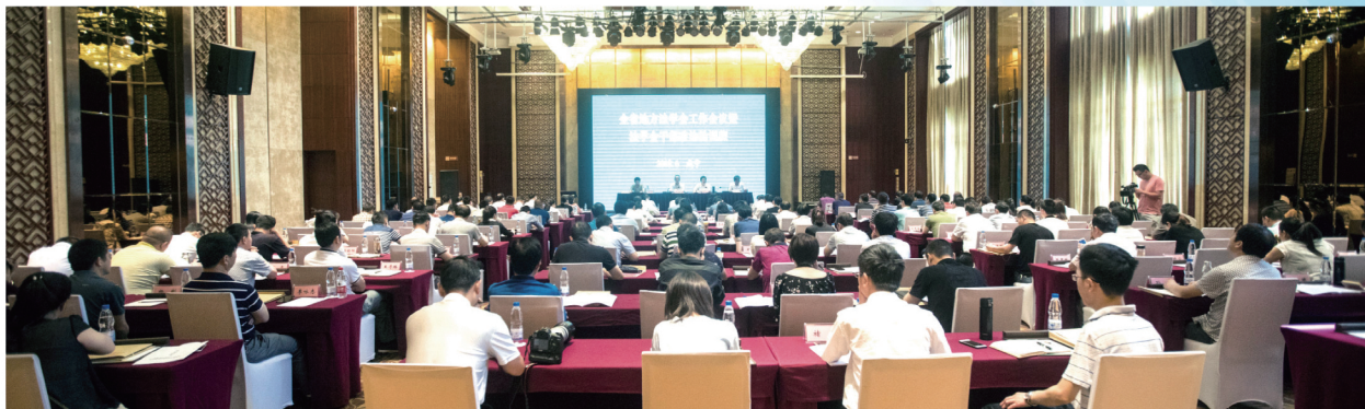
6月5日，湖北省地方学会工作会议暨法学会干部政治轮训班在咸宁召开。