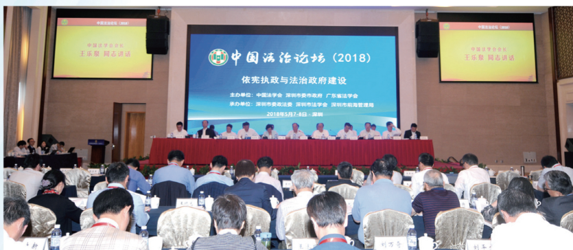
5月7日，中国法治论坛（2018）在广东深圳召开，中国法学会会长王乐泉出席并讲话，中国法学会党组书记、常务副会长陈冀平作总结发言。