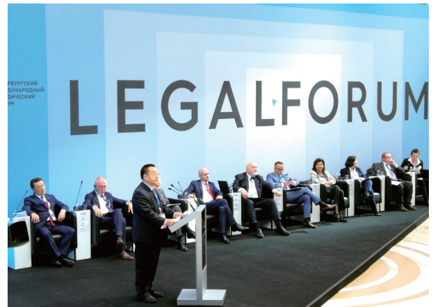
张鸣起赴俄罗斯出席第八届圣彼得堡国际法律论坛

访白俄罗斯期间，张鸣起与白俄罗斯法律家联盟第一副主席、白俄罗斯国家法律信息中心主任科